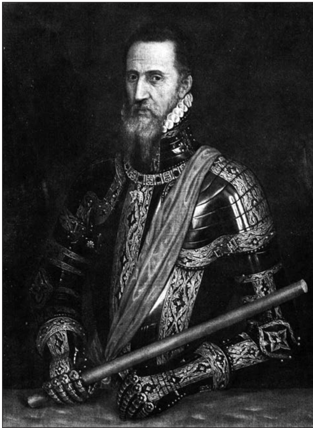
Альба Фернандо Альварес де Толедо. Портрет роботи Тиціана

зокрема при Йегуї 21.07.1568 р. (У герцога Альби було 12 тис. піхоти, 3 тис. кавалерії та кілька гармат, Людовик д'Оран д'Насау мав 10 тис. піхоти, 2 тис. кінноти та 16 гармат, долю битви вирішила артилерія іспанців і їх знаменита терція . Іспанці втратили 80 вбитими і 220 пораненими, голландці — до 7 тис. Але відсутність флоту і поразки від морських гезів змусили Альбу просити відставки. Завоював Португалію (1580) і був там віце-королем (1580—1582). Герцог Альба навчив свою легку кавалерію атакувати у зімкненому строю 5—8 шеренг 4 ;