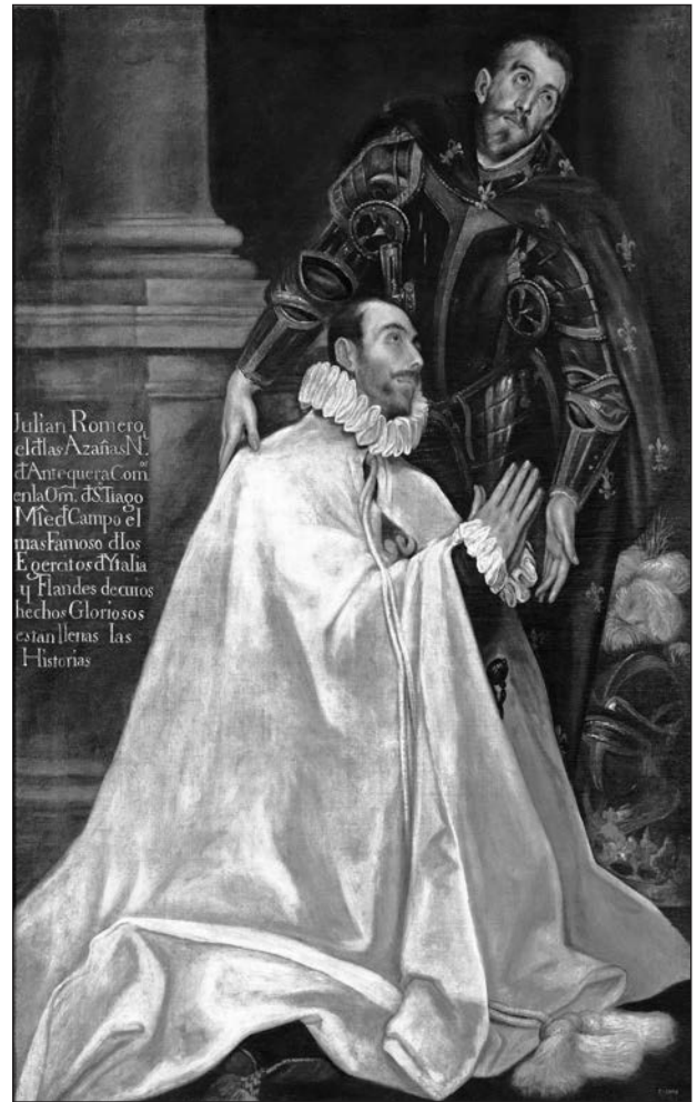
Джуліо Ромеро де Ібаррола зі святим патроном. З картини Ель Греко

Джуліо Ромеро де Ібаррола (1518—1577) пройшов шлях від рядового піхотинця до командира терції (маестро де кампо). Від-