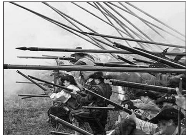
Іспанська терція в бою. Історична реконструкція

класична наймана армія, а дисципліноване військо з високим моральним духом 1 .