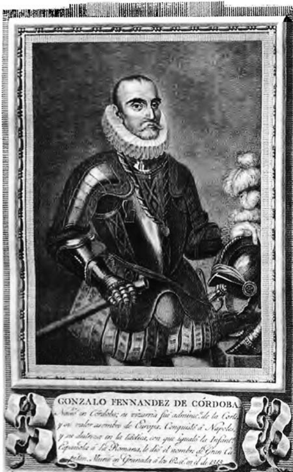
Гонсало Фернандес де Кордова

Іспанська піхота. Основою успіху іспанського війська була іспанська піхота, яка домінувала на полях битв Європи протягом середини XVI — середини XVII ст. Своєрідним поєднанням практик швейцарської баталії, полків ландскнехтів та римських легіонів стала іспанська терція (1534—1704), запроваджена кондотьєром Гонсало Фернандесом де Кордовою на завершальній стадії Італійських війн. Офіційно терція була запроваджена у 1536 р. генуезьким ордонансом короля Карла V замість баталій і коронелій . Терція (tercio) передбачалася у складі 12 рот. Десять рот пікінерів мали у своєму складі по 3 офіцери, 8 унтер-офіцерів, 219 пікінерів (половина з яких була без доспівів) і 20 мушкетерів. Дві роти аркебузирів мали по 3 офіцери, 8 унтер-офіцерів, 224 аркебузира та 15 мушкетерів. Всього в терції з командиром було 3001 чол., в т. ч. офіцерів — 37, унтер-офіцерів — 96, пікінерів — 2190, аркебузирів — 448, мушкетерів — 230. Терція була одночасно і бойовим порядком: три лінії розташовані на зразок римських легіонів у шахматному порядку (дві баталії у першій та третій лініях і