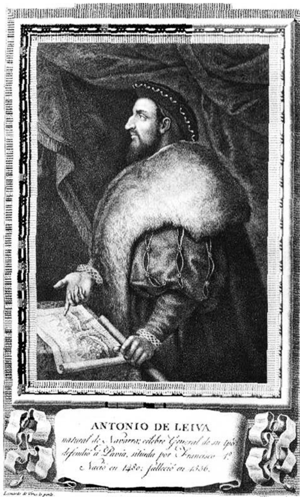
Антоніо де Лейва

Антоніо де Лейва (1480—1536), князь Асколі, герцог Терранова. Розпочав військову кар'єру у 1502 р. на війні з повсталими мудехарами в колишньому Гранадському еміраті. З 1503 р. воював у Іспанії під командуванням Гонсало Фернандеса де Кордова, відзначився у битвах при Равенні (1512) та Павії (1525), з 1525 р. — командуючий імперським військом у Міланському герцогстві, з 1535 р. — губернатор Мілану 2 ;