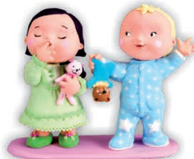
одяг, щоб спати