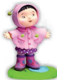
Фото: Рене Брасар