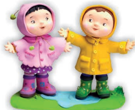
одяг, що захищає від дощу