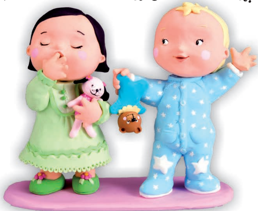
одяг для сання