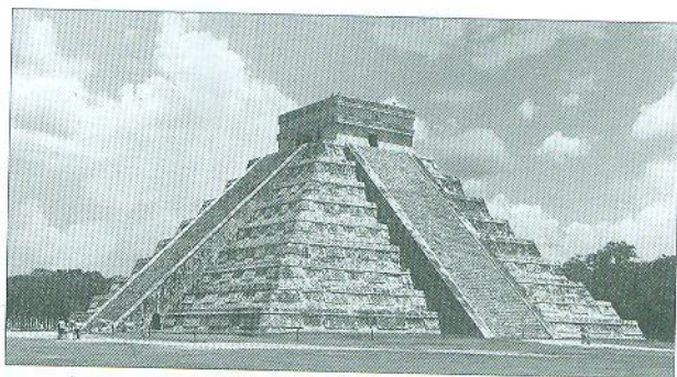
Піраміда Кукулькана. Храм майя та тольтеків, що розташовується в центрі археологічної пам'ятки Чичен-Іца (півострів Юкатан, Мексика).

Коли 1519 року в Мексику вдерлися іспанці, перед ними постала величезна Імперія ацтеків, поділена на тридцять вісім провінцій, з мережею доріг, що сполучали 371 місто-державу. У дивовижній столиці імперії, місті Теночтітлан, височіли величні кам'яні храми, пролягали широкі бруковані вулиці, процвітали ринки, було зведено близько 70 000 помешкань із висушеної цегли. З розширенням імперії на центральну та південну частини Мексики у ній постали складні громади, що спиралися на ґрунтовну правову систему і складну політичну структуру. Було розроблено нові ефективні методи ведення сільського господарства, зокрема терасне рільництво, сівозміну, системи зрошування полів та інженерні дива. В ацтеків процвітали мистецтва, їхня архітектура вражала. Правителів мешика вважали богоподібними, а на вершині суспільного ладу були аристократи, священники та воїни-герої. В палаці імператора було 100 кімнат і 100 ванних приміщень, його прикрашали численні статуї, сади та зоопарк. Знать мешкала у великих кам'яницях, практикувала багатоженство і не мусила працювати руками.