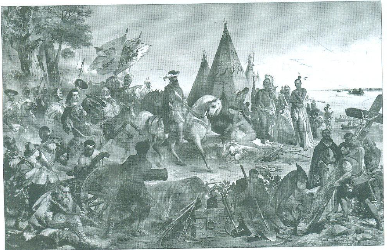
Іспанський конкістадор і дослідник Ернандо де Сото на картині «Відкриття Міссісіпі» (1848–1853 рр.) Вільяма Г. Пауелла у ротунді Капітолія (м. Вашингтон).