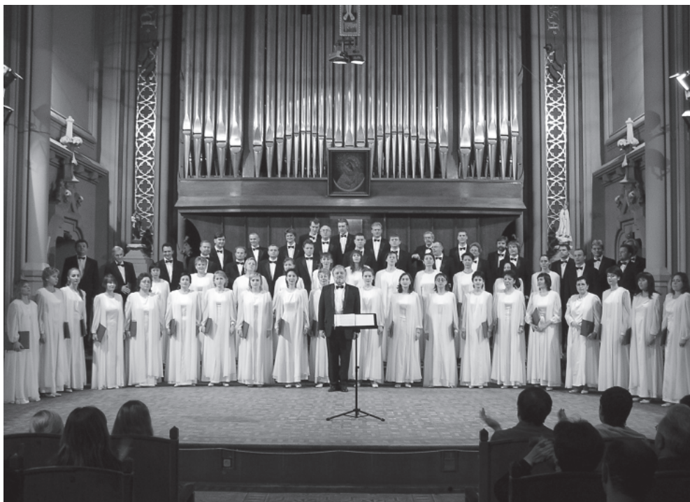
Національна заслужена академічна хорова капела України «Думка»

Виконуйте пісню задушевно, з почуттям любові до рідного краю. Особливу увагу зверніть на образний зміст, у якому передано характер та настрої завдяки вдалому поєднанню поетичного тексту й мелодії.