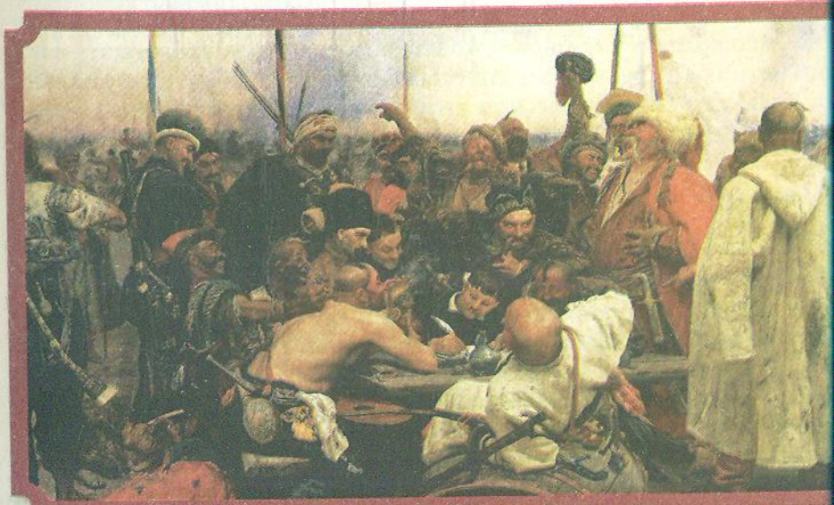
Ілля Рєпін. Запорожці пишуть листа турецькому султану