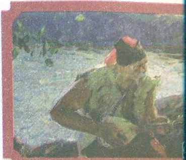
Сергій Коваленко. Зажурилась Україна

Історична пісня « Та, ой, як крикнув же та козак Сірко » присвячена одному з найвизначніших козацьких ватажків. Він виграв 55 великих битв, не враховуючи малих сутичок із ворогом. У світовій історії було лише сім полководців, які не зазнали жодної поразки. Один з них — Іван Сірко (1605–1680 рр.). Серед козаків він мав великий авторитет, багато років поспіль його обирали кошовим отаманом Війська Запорозького. За безпощадність до ворогів турки й татари називали його «Сірко».