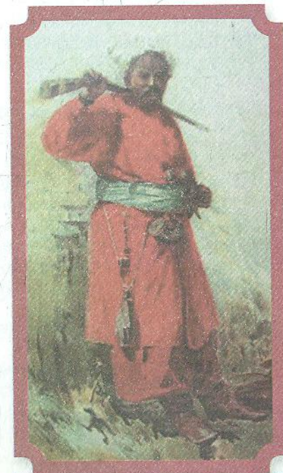
Сергій Васильківський. Тип запорожця