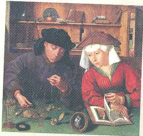
Міньяло і його дружина (картина художника Квентіна Массейса, 1510–1515 рр.)

Розкриваючи зміст Модерної доби, ми звертаємо увагу на якісні зміни в житті саме європейського суспільства. Це зумовлено тим, що за Нового часу цивілізаційні центри пішли власними шляхами розвитку: Західна Європа — шляхом модернізації усіх сфер суспільного життя, а більшість неєвропейських країн ішла власним традиційним шляхом розвитку аграрно-ремісничого суспільства. Тому суспільства неєвропейських країн учені часто називають традиційними .