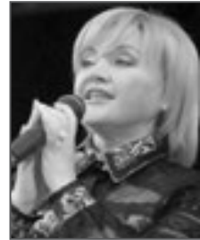
Соломія Крушельницька Володимир Івасюк Оксана Білозір

Що тобі відомо про автора пісні «Червона рута»?