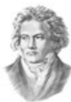
Л. ван Бетховен