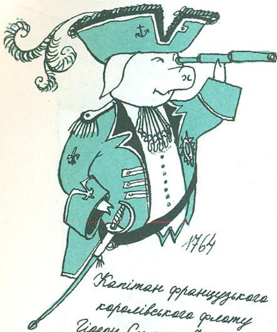
Капітан французького королівського флоту Сідон Сімон Шеллон

У скрині були також малюнок корабля й портрет одного з татових пращурів — капітана французького королівського флоту. Папери виявилися листами, які капітан писав дружині в Нову Англію.