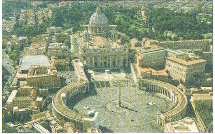
Ватикан: площа і собор святого Петра. Сучасне фото

пробудження після тисячолітнього сну з прагненням відродити античну спадщину.