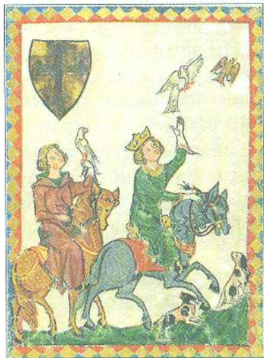
Манеський кодекс. Мініатюра, бл. 1340 р.

Поняття «середньовіччя» з'явилося в ужитку ще в XV ст. в середовищі італійських учених-гуманістів. Відомо, що 1469 р. термін «середній вік» уперше вжив відомий гуманіст і папський бібліотекар Джованні Андреа (1417–1475).