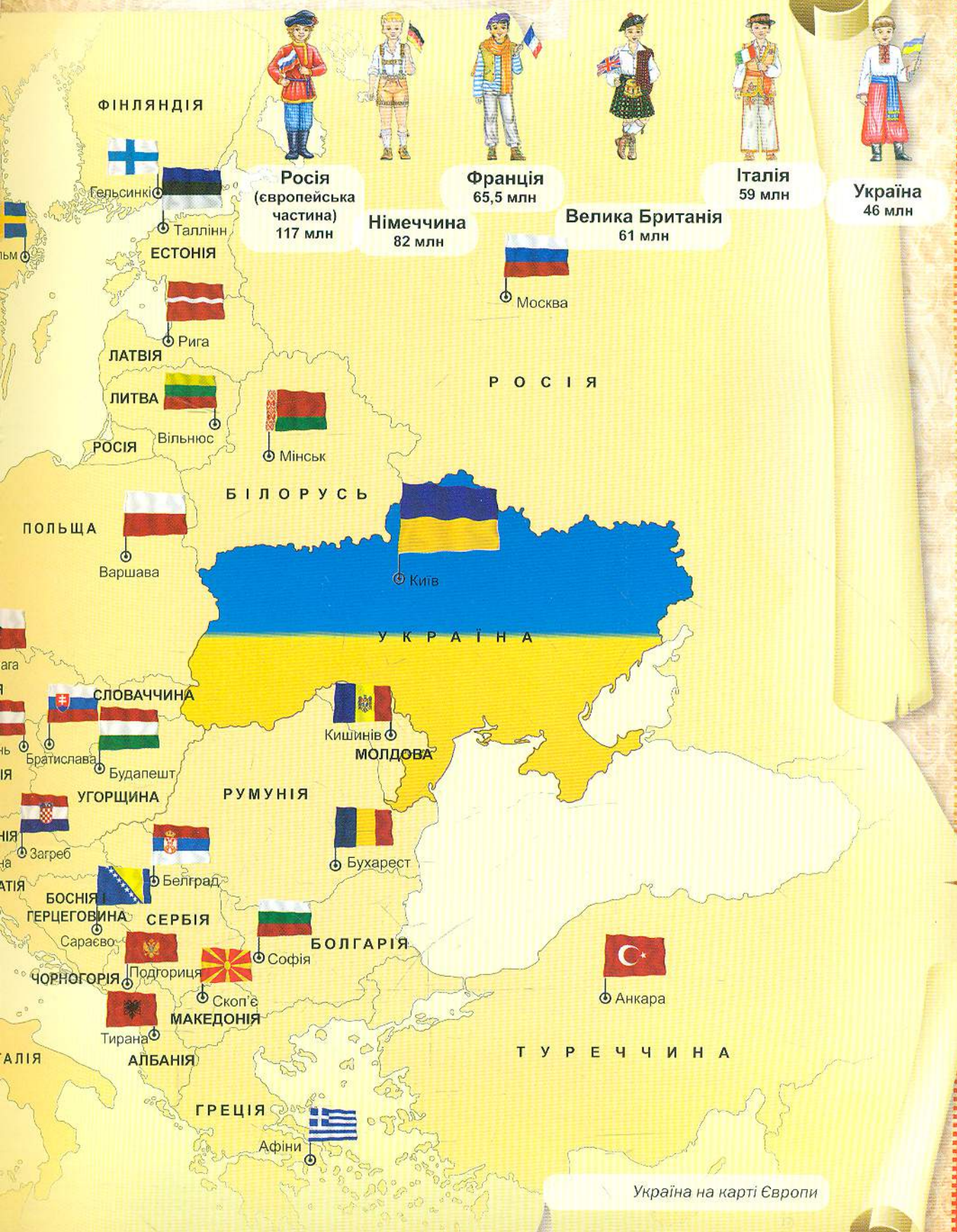
Україна на карті Європи