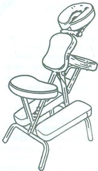
Рис. 1. Масажний стілець