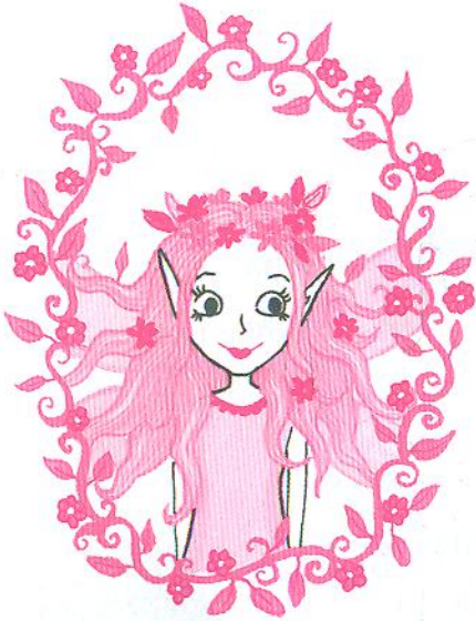
Моя мама графиня Корделія Мун