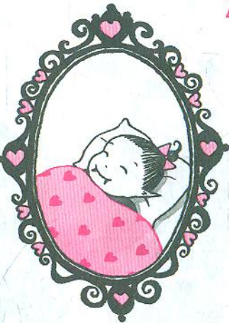
Крихітка Медова Квіточка