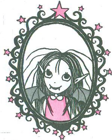
Я! Айседора Мун