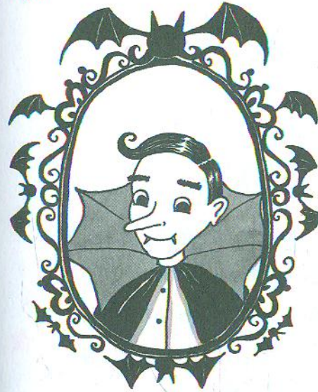
Мій татко граф Бартолом'ю Мун