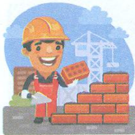
Murarz [мўляж] муляр