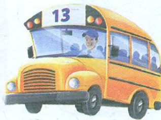
Kierowca autobusu [керóвца аутобўсу] водій автобуса