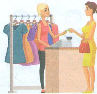
Sprzedawca odzieży [спшедáвца оджéжи] продавець одягу