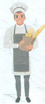
Piekarz [пéкаж] пекар