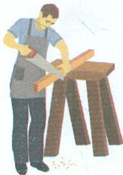
Cieśla [чéшьля] тесляр