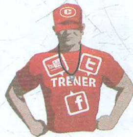
Trener [трéнер] тренер