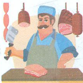
Rzeźnik [жéжьнік] м'ясник