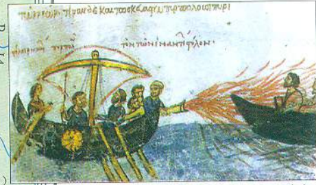
Візантіїці підпалюють кораблі русів «грецьким вогнем»