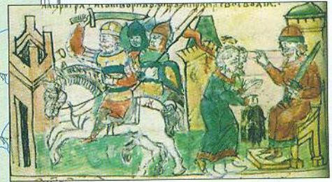
Збір данини (полюддя) князем Ігорем