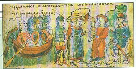
Олег показує Аскольду і Діру малолітнього Ігоря