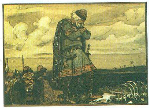
Князь Олег. З картини В. Васнецова