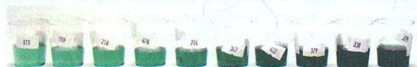
Рисунок 3. Красительный раствор.

На слепых людей цвет продукта не может оказывать влияние. Следовательно, поскольку отсутствует раздражитель зрения, то возникает вопрос: компенсируют ли слепые люди это с помощью более развитых других органов чувств? Было проведено исследование, в котором анализировали, могут ли слепые и зрячие люди провести