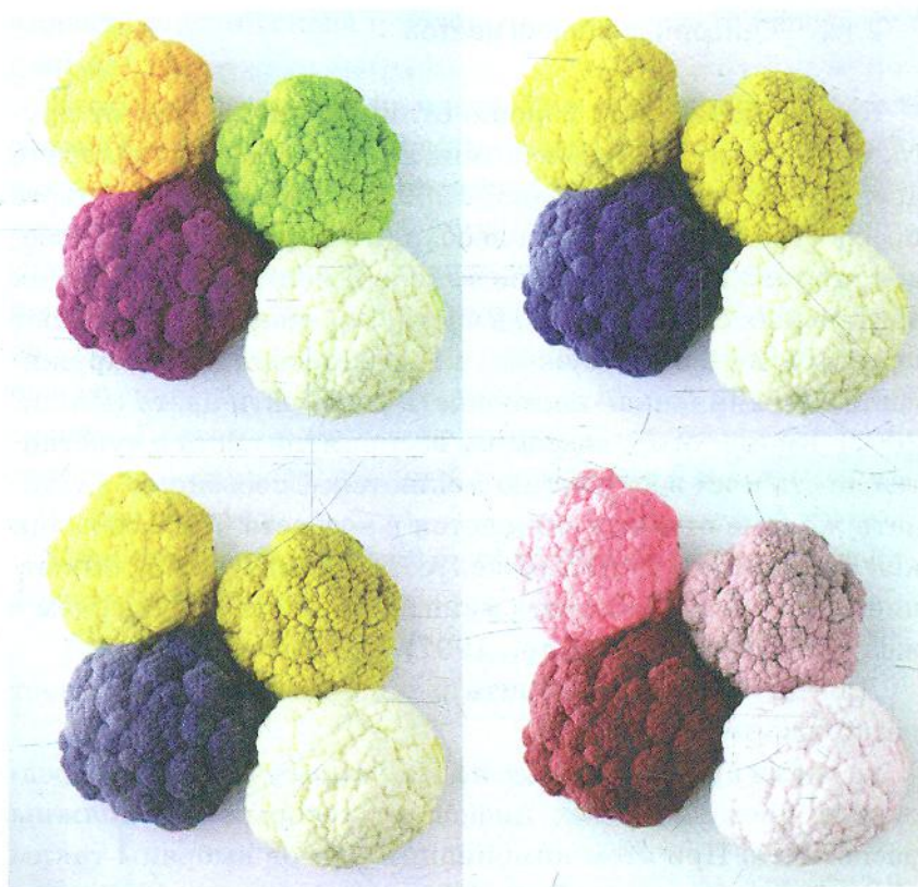
Рисунок 2. Стандартное зрение (2a), Протанопия (2b), Дейтеранопия (2c), Тританопия (2d).