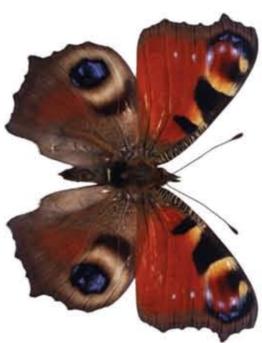
Денне павичеве око