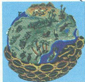
Світ за уявленням народу фон (Африка)

Утім, за всього розмаїття різні міфології мають чимало спільного. Наприклад, у багатьох народів є міфи про походження Всесвіту. Часто в них ідеться про те, що народженню Всесвіту передував Хаос 1 , з якого народилися перші космічні стихії або перші боги. Цікаво, що сам Усесвіт нерідко зображували в образі величезного дерева, яке об'єднує три світи: підземний світ розташований у його корінні, земний — посередині стовбура, а небесний — у кроні.