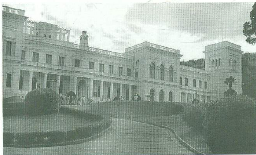
Лівадійський палац. 2012 р.