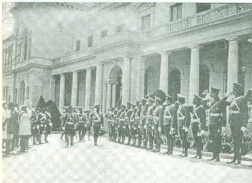
Російський імператор Микола II вітає перед Лівадійським палацом офіцерів полків, дислокованих у Криму. 1912 р.