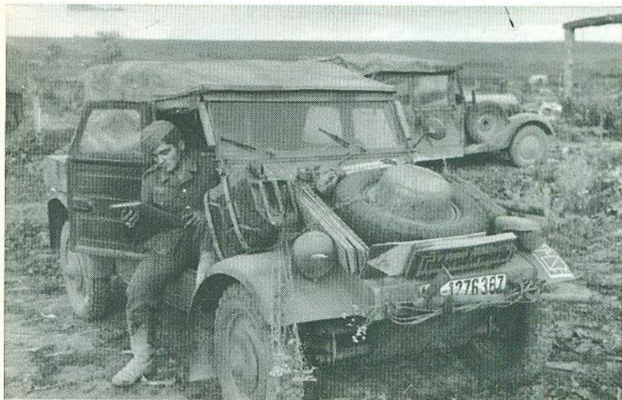
Легкий німецький армійський автомобіль “Kubelwagen Typ 82” [1]

кість на шосе – 80 км на годину й витрата бензину – 9 л на 100 км. Добра прохідність бездоріжжям. Недаремно після капітуляції Німеччини американці міняли такий трофей на три свої найкращі джипи “Willys MB” [1]. Єдине, що під час бойових дій у Польщі, Франції та СРСР до бокових і задньої частин “Kubelwagen” приварювали захисні сталеві листи.