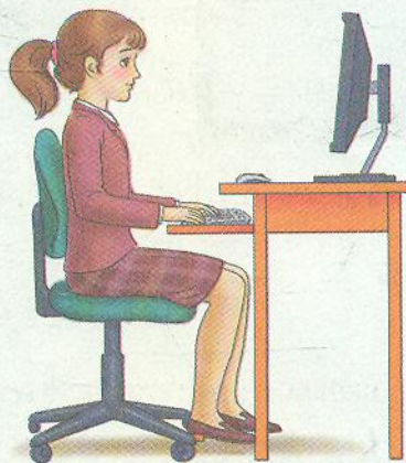
Мал. 1.1. Постава під час роботи з комп'ютером