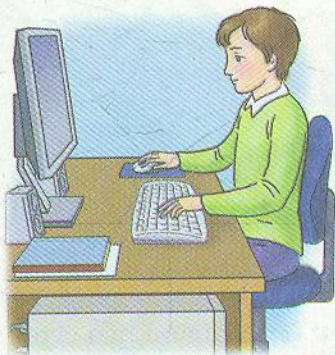
Мал. 1.3. Під час роботи з комп'ютером