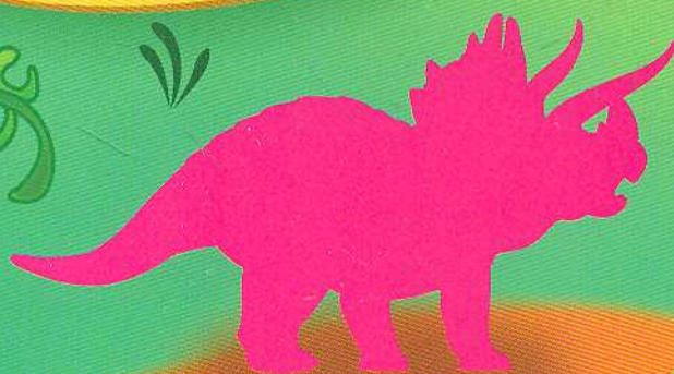
Трицератопс Triceratops [трайс'еретопс]