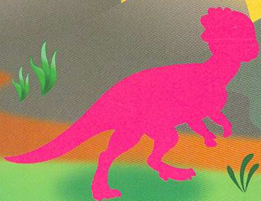
Пахіцефалозавр Pachycephalosaurius [пакіс'ефолос'орес]