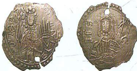
Срібна монета Володимира Великого

Згодом карбувався на срібних монетах Володимира Великого. З одного боку монет зображувався сам Володимир, а з іншого — тризуб і напис: «Володимир на столі, а се — його срібло». Як символ князівської влади тризуб був поширений на наших землях упродовж кількох століть.