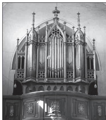
м. Самбір Львівської області, орган костьолу Іоанна Хрестителя

Якими засобами музичної виразності композитор передав зміст і характер віршованого тексту в музиці?