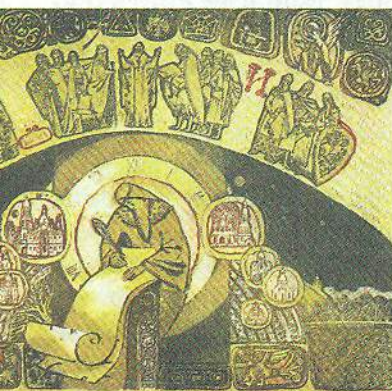
А. Мільковицька. Київ древній

Освітлені м'яким розсіяним світлом, на полицях поблискують тьмяно-золотаві корінці сотень книг. Вони розташувалися на стелажах довгими, стрункими рядами. У кожній – своя історія, своя доля, своя мета. Є серед них книги, що стають всесвітньо відомими і авторитет яких із часом не зменшується. Є й менш значущі, ті, що вершать тихі й непомітні щоденні подвиги. Адже всі разом вони – «німі вчителі», як висловився про книги давньогрецький філософ Платон.