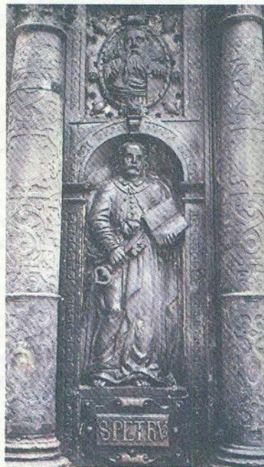
Скульптурне зображення на стіні каплиці Боїмів у Львові