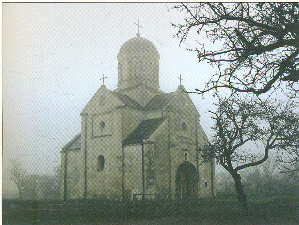
Церква Святого Пантелеймона

Серед численних малюнків храму Св. Пантелеймона найвиразнішим вважається квітучий хрест — ранньохристиянський символ перемоги життя над смертю. Його можна побачити і на гербі сучасного Галича.