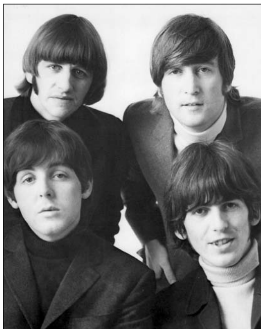
“Бітлз” (The Beatles), британський біт-рок-гурт, створений 1960 р.