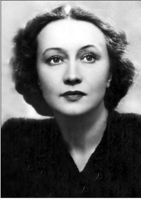
Галина Уланова (1910–1998 рр.), радянська і російська балерина