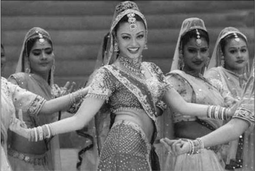
Айшварія Рай (нар. 1973 р.), індійська актриса і танцівниця. Кадр із фільму “Навіки твоя”