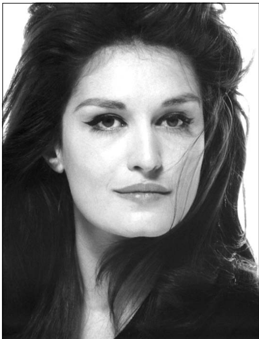
Даліда (1933–1987 рр.), французька співачка і актриса