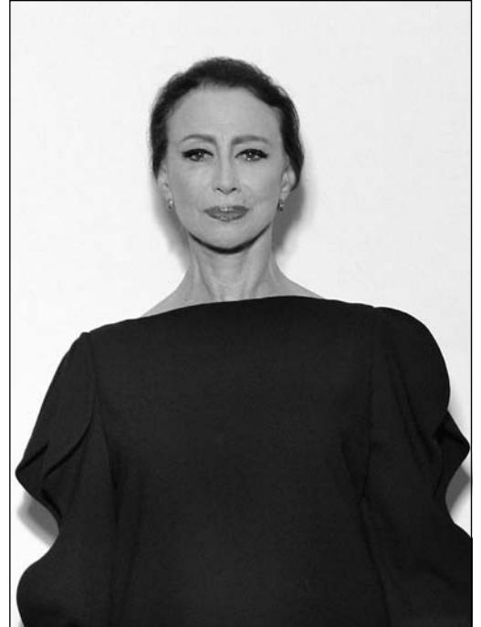
Майя Плесецька (нар. 1925 р.), радянська і російська балерина