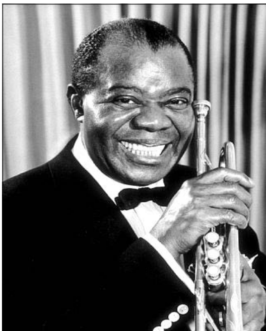
Луї Армстронг (1901–1971 рр.), американський джазовий музикант, співак, сурмач