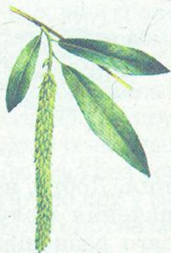
прислів'я і приказки