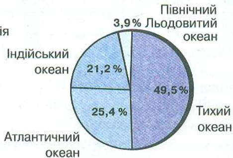
Мал. 1. Співвідношення й розподіл площ суходолу та Світового океану