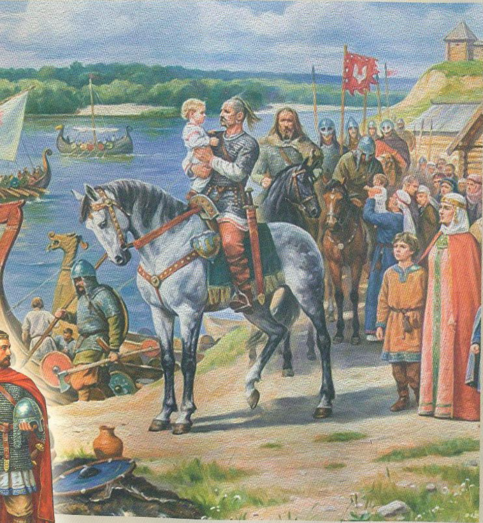
Худ. А. Орльонов