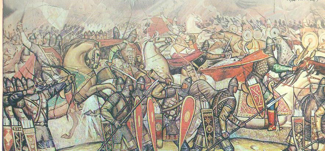
Худ. П. Андрусів

У 9 ст. князь Олег об'єднав слов'янські племена в одну державу, а потім приєднав до неї й інші племена та землі. Так постала Київська Русь – величезна країна від Чорного та Каспійського морів до Балтійського моря. Князі Київської Русі остаточно здолали хозарів та печенігів аж у 11 ст. Але на сході виникла нова загроза – половці. І ще 200 років із цими новими сусідами руси то билися, то мирилися.