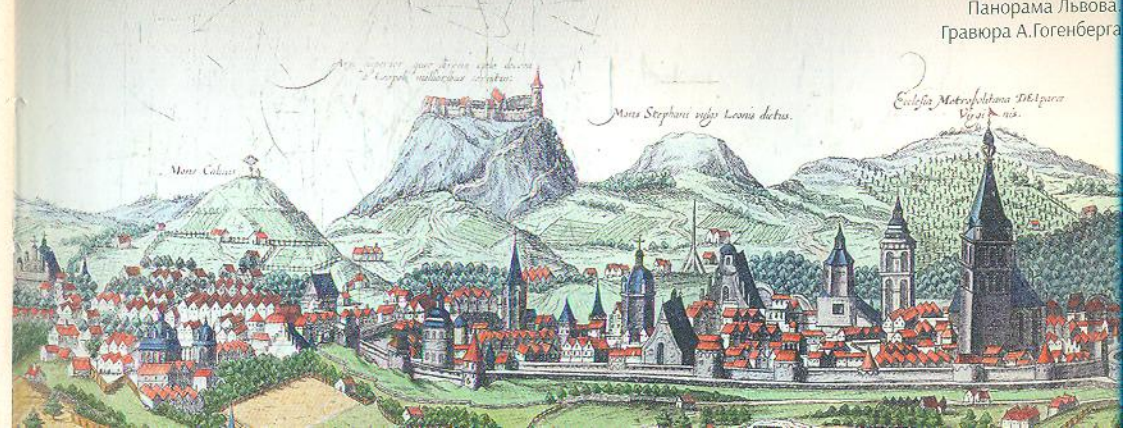
Панорама Львова. Гравюра А. Гогенберга

Галицько-Волинська держава простояла ще століття – до 1349 р., а Київська Русь 1240 р. перестала існувати як єдина держава.