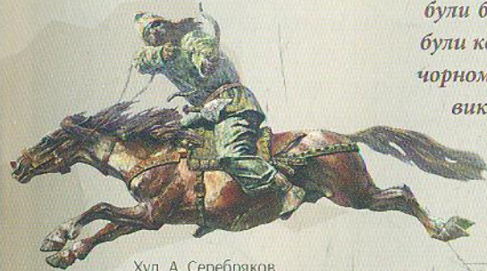
Худ. А. Серебряков

Ворогами наших предків, як і кожної країни у ті часи, були близькі та далекі сусіди. Найбільш небезпечними були кочовики. Зі сходу та півдня, з азійських та з причорноморських степів приходили нові й нові орди кочовиків. У 6–8 ст. наші землі спустошували авари (у літописі їх названо обрами). У 7 ст. з'явилися хозари, у 8 ст. – печеніги. Боротьба з ними тривала кілька століть.