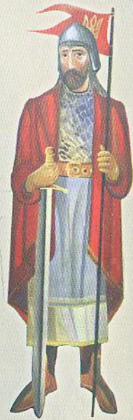
Худ. Т. Откович

Через три місяці облоги супротивники му-сили укласти мирну угоду: руси поверта-лись додому, а візан-тійці займали форте-цю Доростол.