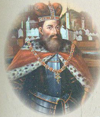
Король Лев Данилович

Наприкінці 11 ст. Київська Русь ослабла. Князі билися між собою, війна у Русі точилася безперервно, хоч у різних місцях. Тож коли у половецьких степах з'явилася нова грізна сила – монголи, годі було сподіватись, що пересварені князі зможуть дати їй відсіч. У Київській Русі лишилось одне сильне князівство – Галицько-Волинське, яке постало 1199 року, коли волинський князь Роман об'єднав Галичину і Волинь під своєю орудою.