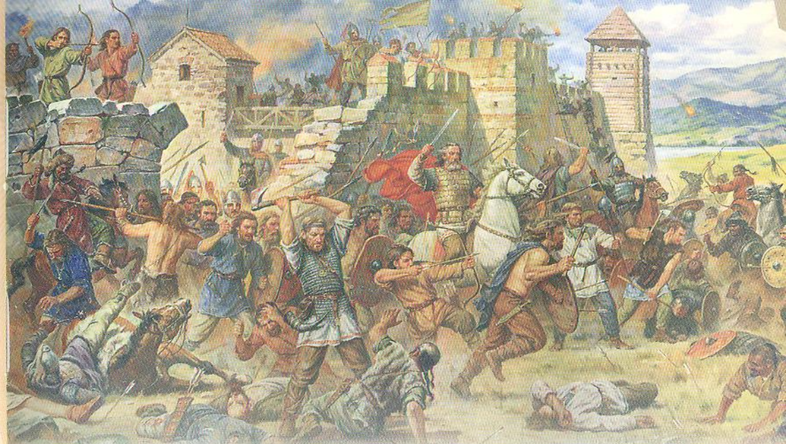
Худ. А. Орльон

Візантійці справді пропустили русів, але підмовили печенігів влаштувати їм засідку. У бою з печенігами Святослав загинув.